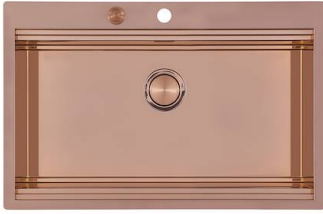
RIVA 750 COPPER N034 F58